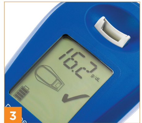
Gefüllte Küvette einsetzen und sanft nach unten drücken